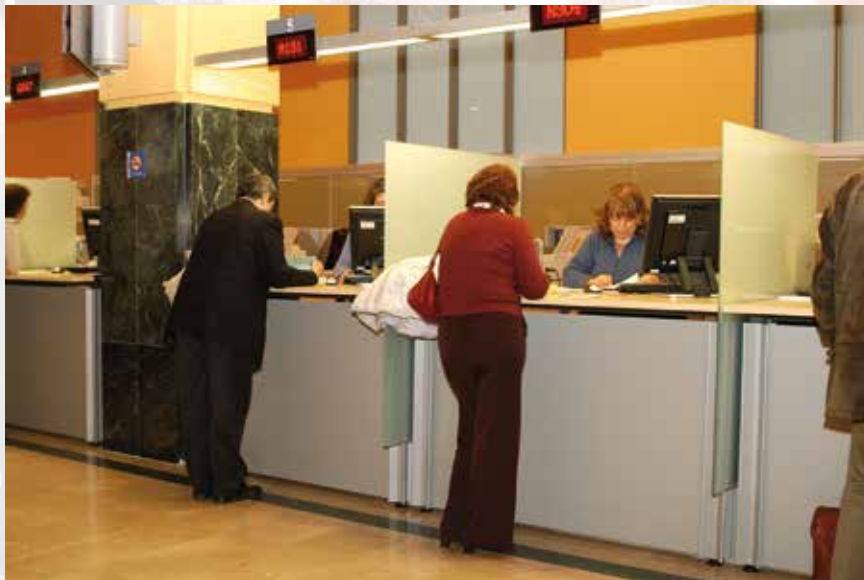
La contratación centralizada abarata precios y garantiza servicios de calidad.

En la notificación están incluidos los detalles de la infracción (en qué lugar se ha producido, fecha y hora de la misma, normativa infringida e importe de la sanción aplicada) y una serie de datos de contacto, como teléfono, correo electrónico y clave de acceso a un portal de internet, para que el san-