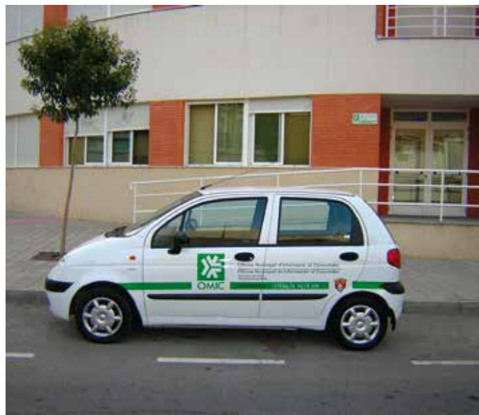
Una de las consultas realizadas hace referencia a las competencias locales sobre las OMIC.

Por ello, para su ejercicio deberían seguirse las pautas referidas para este tipo de competencias o bien requerir a las Comunidades Autónomas para que efectúen su delegación.