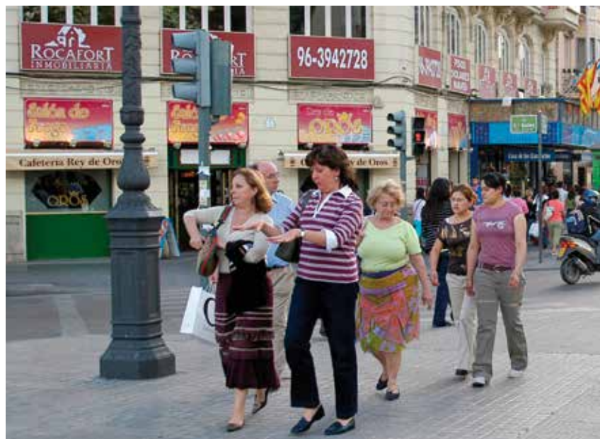
La declaración responsable permite reducir trabas burocráticas para emprender un negocio. En la imagen, una calle comercial.

Las incorporaciones se han realizado sobre las condiciones de uso de la plataforma, concretamente en tres de sus cinco puntos, así como en el modelo de adhesión de los Entes Locales. La adición fundamental