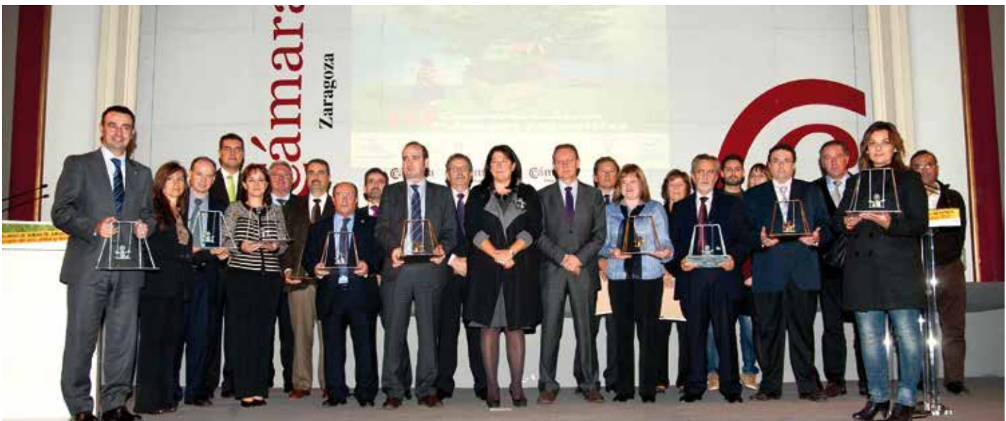
Ganadores del Columpio de Oro en la pasada edición,

En esta jornada intervendrán representantes del IDAE, empresas de ingeniería y consultoras, junto a representantes de los Ayuntamientos