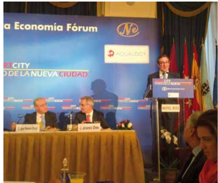
El Alcalde de Santiago, durante su intervención.

El segundo eje es el que busca el diseño de sistemas de gestión eficiente para otro tipo de soluciones. En concreto, se explora implantar una herramienta de monitorización y soporte a la toma de decisiones para la problemática específica de entornos Patrimonio, que permitan al Consistorio, por ejemplo, identificar las causas por las que determinadas zonas