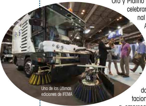
Una de las últimas ediciones de IFEMA

Los galardones tratan de estimular la aplicación de los avances tecnológicos destinados a aumentar sostenibilidad de las ciudades.