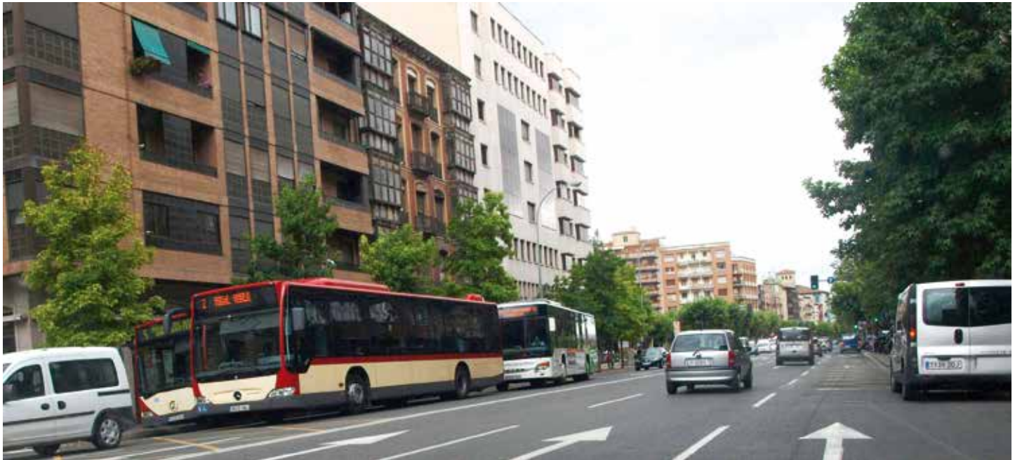
Logroño se incorporó a TESTRA en 2012.

El 25 de mayo finaliza el plazo para que los Ayuntamientos, Diputaciones Provinciales y organismos similares, con competencias en la materia, puedan incorporarse al sistema de notificación de expedientes sancionadores TESTRA. A día de hoy ya son casi mil las Entidades Locales adheridas.