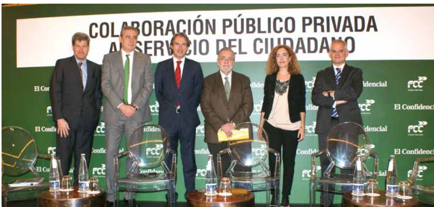
El Presidente de la FEMP, tercero por la izquierda, antes de comenzar.