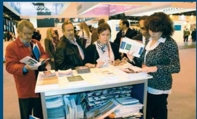
Visitantes de la feria en el stand de la FEMP

Cataluña, Canarias, Baleares y Andalucía fueron las Comunidades con participación en el total del gasto, registrando subidas aumentos que oscilaron entre el 13,4% y el 8,3%, durante 2013.