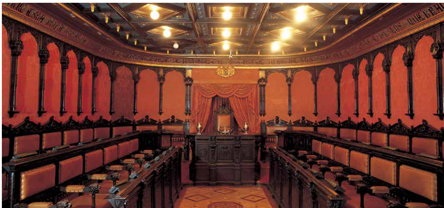
En circunstancias muy determinadas, la Junta de Gobierno podrá aprobar los Presupuestos, una competencia que, con carácter general, corresponde al Pleno

La página web de la Federación ya ofrece el acceso a una Oficina de Información sobre la Ley de Racionalización y Sostenibilidad de la Administración Local (LRSAL), a la que podrán dirigirse todos los responsables locales interesados en formular las consultas que les suscite la aplicación de esta nueva norma.