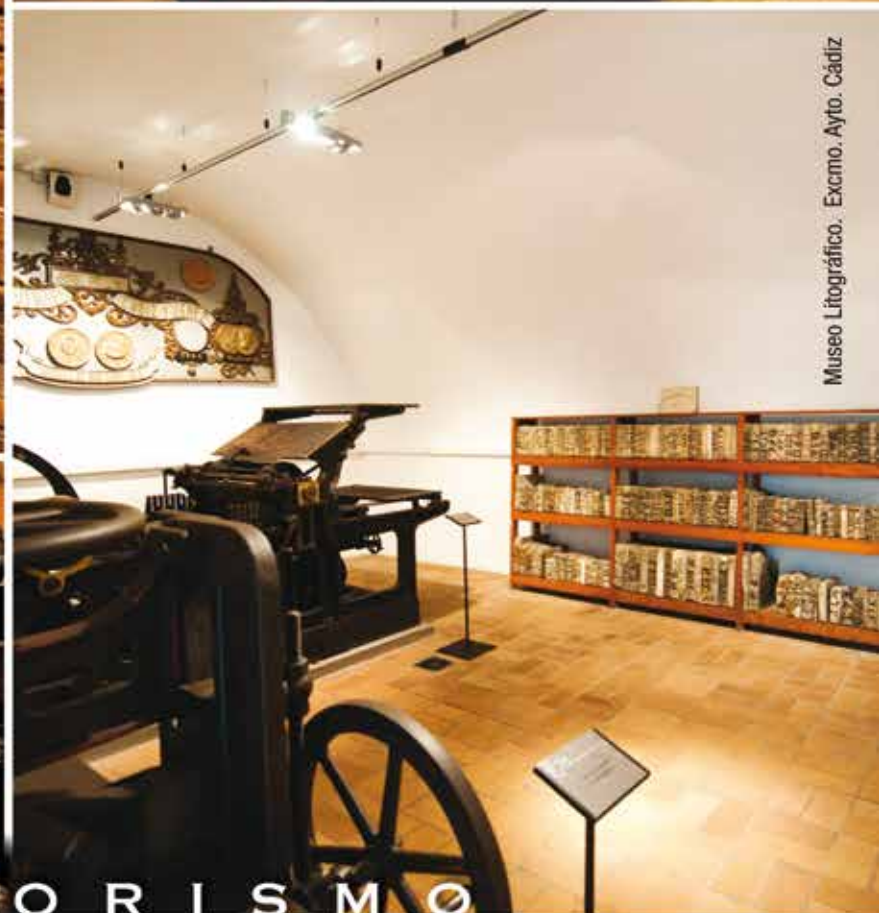
Museo Litográfico. Excmo. Ayto. Cádiz