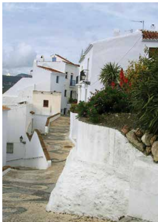
Mirador del Peñón, en Frigiliana.

La capital riojana suma este reconocimiento al concedido en septiembre por el Comité Español de Representantes de Personas con Discapacidad (Cermi) como "Mejor acción autonómica y/o local por su trabajo para reactivar la acción pública en materia de discapacidad" . ★