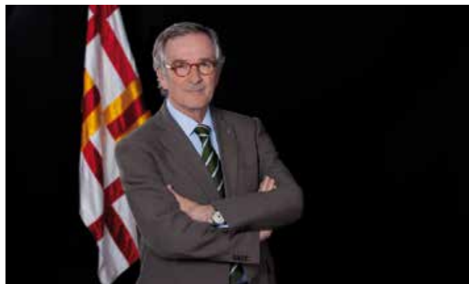
En la imagen, el Alcalde de Barcelona, Xavier Trias.

Como apoyo al sistema, recordó la solvencia de su Consistorio, que "no tiene déficit" y que viene pagando a sus proveedores a 30 días. Precisamente ha sido esta estabilidad financiera municipal, sumada a las inversiones para crear infraestructuras y equipamientos, lo que ha permitido crear puestos de trabajo.