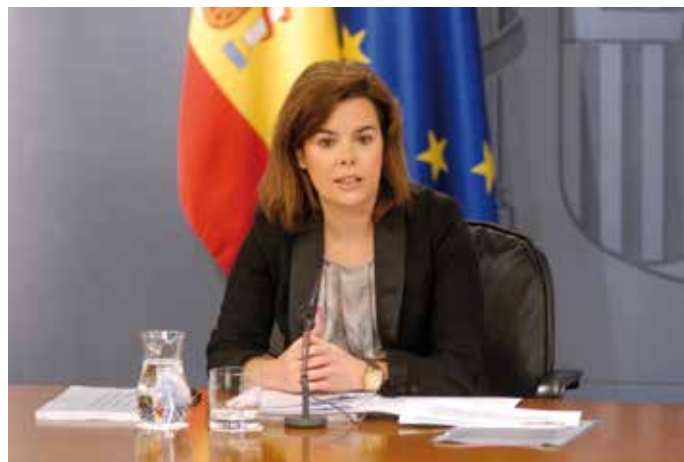
La Vicepresidenta anunció en un Consejo de Ministros la desaparición de más de 1.000 entes instrumentales locales.

Los redactores del informe consideran que los efectos de estas medidas se verán incrementados con la entrada en vigor este año de la