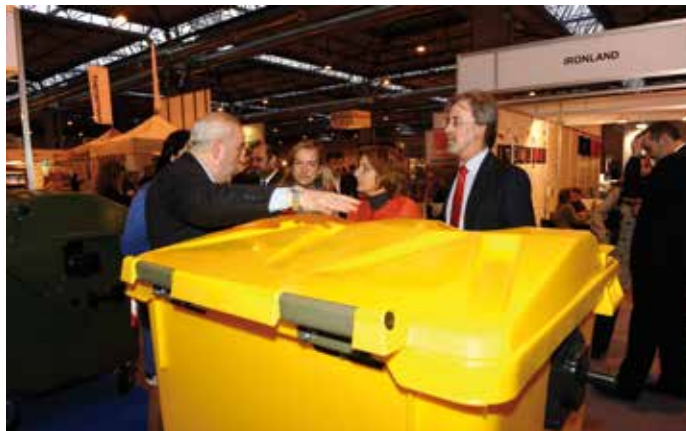
ExpoAlcaldía y SID Tecnodeporte reunirán las principales novedades en equipamientos urbanos e instalaciones deportivas.

Coincidiendo con ambos certámenes, se entregarán los denominados "Premios Columpio" , a través de los cuales se reconocen las mejores áreas de juegos infantiles.