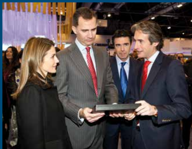
El Alcalde de Santander conversa con los Príncipes y el Ministro de Industria.