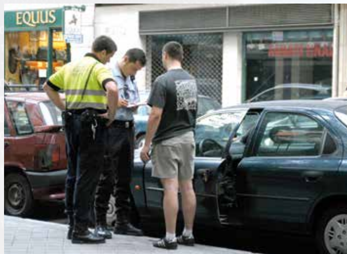
Desde julio de 2012 la FEMP ofrece la posibilidad de cobrar multas impuestas a ciudadanos extranjeros por infracciones cometidas en España.

El servicio contempla la colaboración en procesos de licitación y seguimiento de las medidas finalmente implantadas, así como la elaboración de un plan de optimización del gasto y control de costes, que permitirá