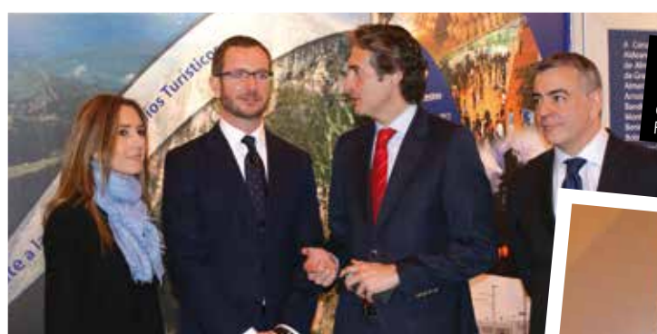
El Alcalde de Vitoria, Javier Maroto, en el stand de la FEMP, con el Presidente de la Federación.