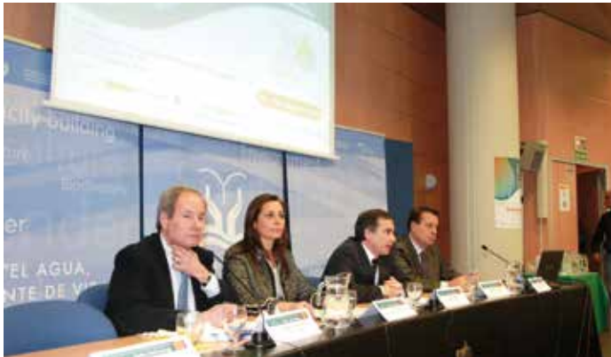
Un momento del acto inaugural de la Conferencia.

La cooperación entre los sectores del agua y de la energía y de éstos con los Gobiernos es vital para asegurar el acceso al agua en el mundo en condiciones de eficiencia y sostenibilidad. Ésta es una de las principales conclusiones de la Conferencia Anual ONU-Agua preparatoria del Día Mundial del Agua, celebrada en Zaragoza del 13 al 16 de enero.