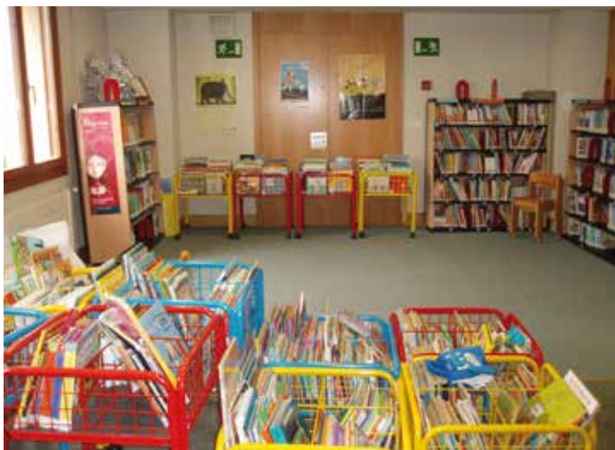
Biblioteca de Iurreta (Vizcaya)

La cuantía del premio asciende a 12.000 euros para los municipios ganadores. Asimismo los 300 municipios preseleccionados recibirán un lote de libros