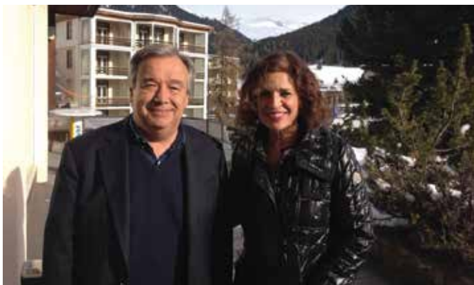
La Alcaldesa de Madrid, Ana Botella, junto a Antonio Guterres.

Los Alcaldes de las principales ciudades del mundo han sido invitados, por primera vez, al Foro Económico Mundial, celebrado en Davos el pasado enero. La Alcaldesa de Madrid, Ana Botella, y el Alcalde de Barcelona, Xavier Trias, acudieron a la cita y participaron en los debates.