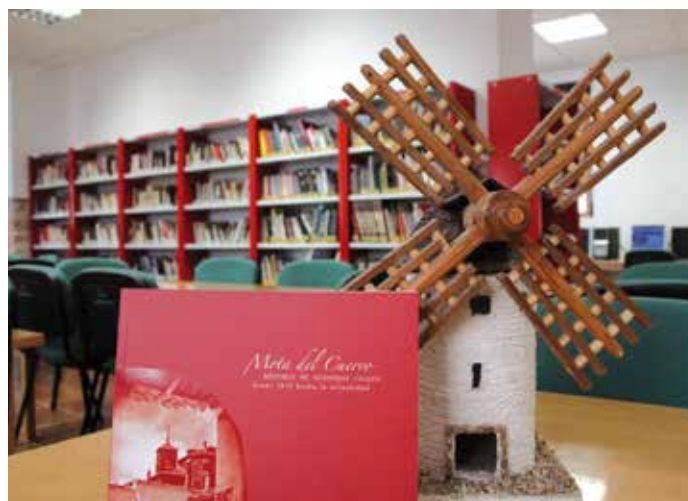
Biblioteca de Mota del Cuervo (Cuenca)

La Fundación Coca-Cola Juan Manuel Sainz de Vicuña nació en 1993 con el objetivo de impulsar el desarrollo cultural y educativo de la juventud española a través del Teatro, el Arte Contemporáneo, la Literatura o la Educación. ★