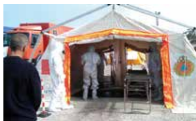
Actividades de descontaminación en el simulacro realizado.

Los doce Alcaldes de los municipios que componen la Zona 1 del Plan de Emergencia Exterior de la Central Nuclear de Almaraz recibirán de manos del Ministro del Interior, Jorge Fernández Díaz, la Medalla de