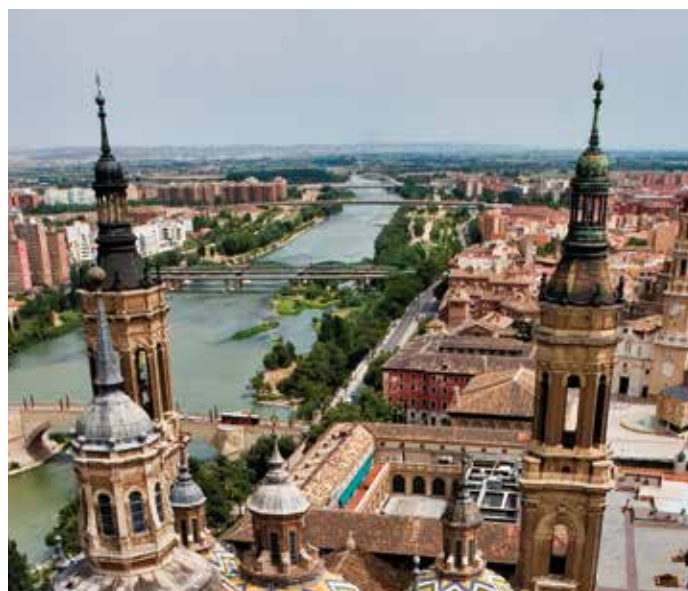
Zaragoza viene desarrollando políticas de fomento de la rehabilitación urbana desde 1989.