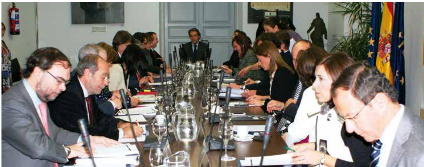
La reunión del pasado 28 contó de nuevo con la asistencia de los representantes socialistas.

La Federación ha solicitado al Gobierno que revise el tipo de interés de los préstamos que vienen asumiendo los Ayuntamientos que se acogieron al primer Plan de Pago a Proveedores, y que se sitúa en torno al 6%. Para el Presidente de la FEMP, Íñigo de la Serna, se trata de una reivindicación justa al ser las Entidades Locales las Administraciones que más y mejor están cumpliendo con los objetivos de déficit y deuda.