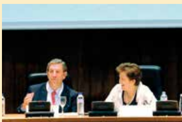
La Secretaria General de Consumo, Pilar Farjas (arriba junto al Presidente de la Red Española de Ciudades Saludables) presidirá el nuevo organismo.

En el mismo Consejo de Ministros, el Gobierno aprobó un Real Decreto por el que se refunden el Instituto Nacional de Consumo y la Agencia Española de Seguridad Alimentaria en un nuevo organismo denominado Agencia Española de Consumo, Seguridad Alimentaria y Nutrición (AECOSAN). Ambos organismos compartirán ya misión en cuanto a la protección de la salud y seguridad de los consumidores y usuarios.