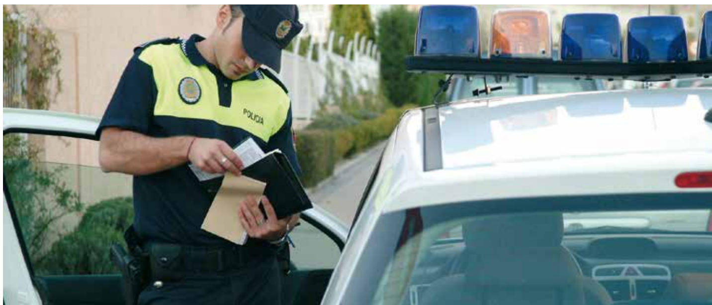
Policía Local de Rivas (Madrid).

En el caso de Soria, por cuestiones prácticas, desde diciembre de 2012 hasta fin del año 2013, las notificaciones fallidas se publicaron simultáneamente en el BOP, el Tablón de Edictos del Ayuntamiento y en el TESTRA, informando al ciudadano que la notificación también era publicada en este