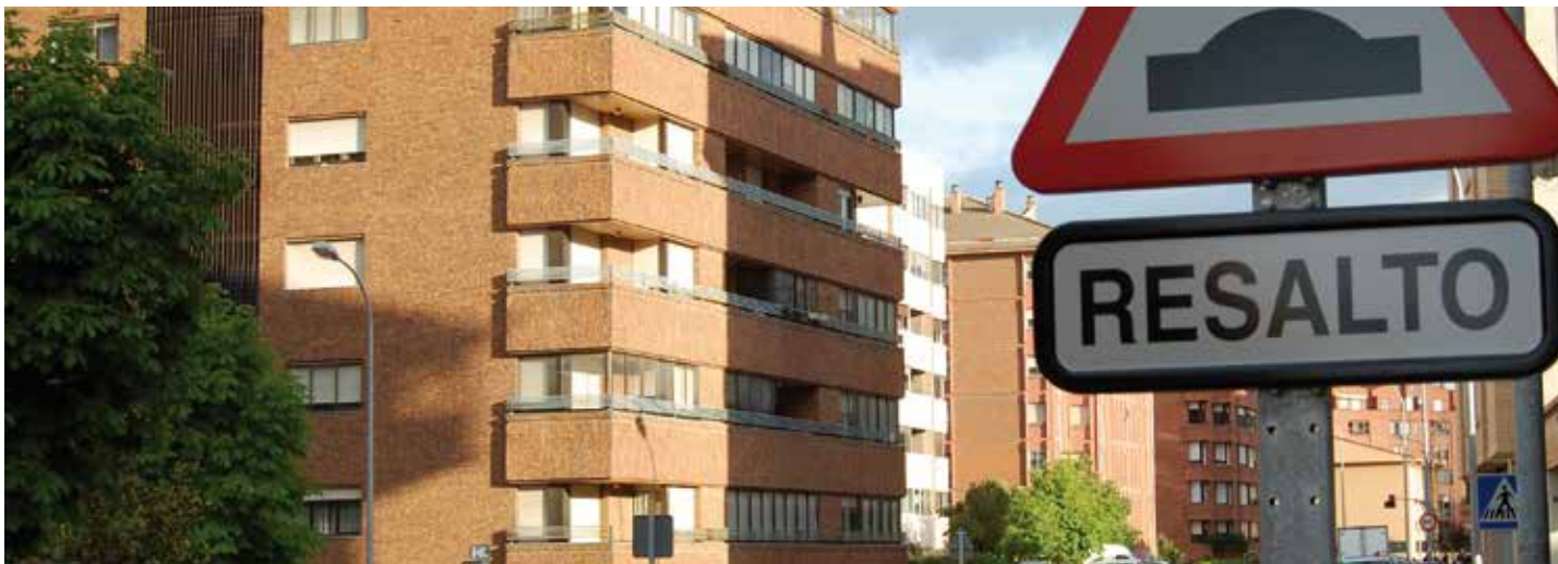
El Alcalde de Soria destaca las ventajas para el usuario. En la foto una imagen urbana de esta ciudad.

último. Desde el punto de vista de la tramitación administrativa "se advierte una mayor utilización de este servicio por parte del ciudadano que la tradicional publicación en el BOP y una eficacia al alza en las notificaciones a través de edictos" , señala el Alcalde.