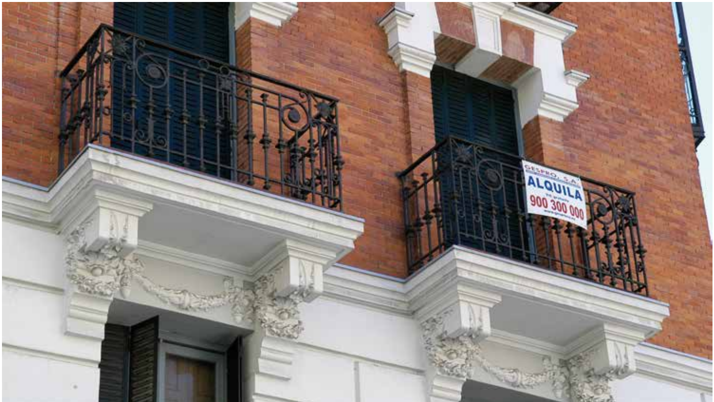
La nueva normativa busca impulsar el alquiler de viviendas

El pasado 22 de enero Zaragoza acogía el tercer y penúltimo de los Seminarios 3R sobre Nuevo Modelo Urbano, fruto de la colaboración entre la FEMP y el Ministerio de Fomento, concebidos para acercar a responsables locales las repercusiones de la nueva normativa destinada a impulsar la rehabilitación de edificios, la regeneración y la renovación urbanas. En febrero será Málaga la ciudad anfitriona del último de estos encuentros.